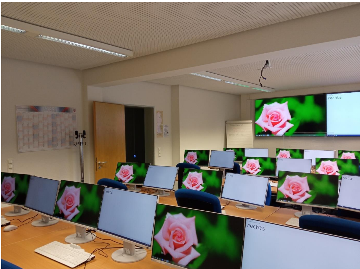
Foto aus einem Schulungsraum der IT-Stelle (4 Reihen á 3 Arbeitsplätze, jeweils mit zwei Bildschirmen pro Platz)

In das alphadidact® Digital Multimediasystem sind jeweils 1+12 bis 16 Doppelbildschirm-Arbeitsplätze, Dokumentenkameras, Laptops sowie zwei 85" Displays eingebunden.